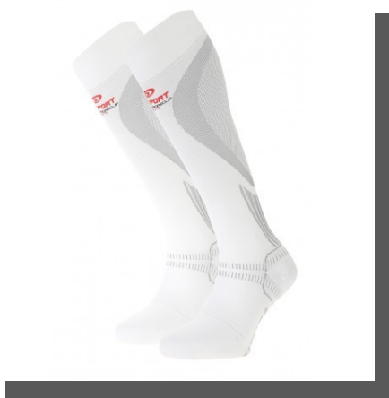
Les chaussettes Prorécup' Elite

Le plus gros impact a été ressenti avec les chaussettes de récupération. Mises après la course, elles permettent une récupération active et bénéfique. On ressent après les avoir porté 1 à 2 heures une réelle sensation de légèreté. Les produits BV Sport permettent d'enchaîner les courses sans problème de récupération musculaire. L'ensemble du Team est très satisfait de ces produits.