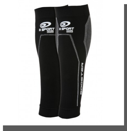
Les manchons booster Elite